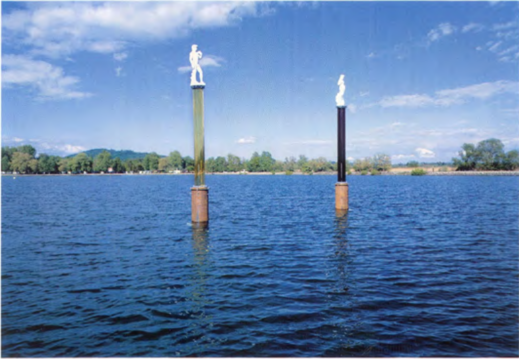
Pavel Schmidt, «Poseidon und Venus» 52